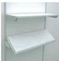
9 | 平层板 / 斜层板 Flat Shelf / Sloped Shelf 1000 x 300W mm