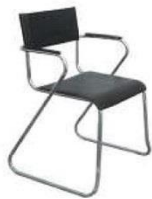
5 | 黑皮椅 Leather Arm Chair (Black) 570 x 440 x 760ht mm