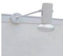
13 | 长臂射灯 Longarm Spotlight 100W