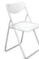
4 | 折椅 Folding Chair 460 x 400 x 720ht mm