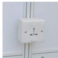
15 | 500瓦单相插座(只供标准展台) Power Socket Max. 500W