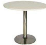
3 | 白圆桌 Round Table (White) dia. 800 x 720ht mm