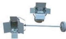
14 | 金卤灯 HQI 150W