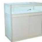
12 | 标准玻璃展示柜 Low System Showcase 1030 x 535 x 1000ht mm