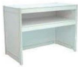
1 | 咨询台 Information Desk 1030 x 535 x 750ht mm