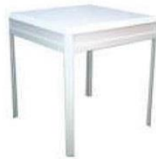
2 | 方台 Square Table 700 x 700 x 715ht mm