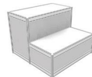
8 | 高低展柜 Showcase 1030 x 535 x 750/310 ht mm