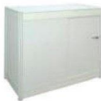
6 | 锁柜 Lockable Cabinet 1030 x 535 x 750ht mm